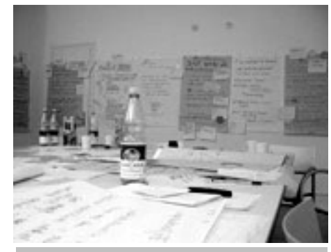
[1] Ideen mit System